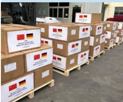
Die Spende ist bereit zum Transport von Ningde nach Thüringen.