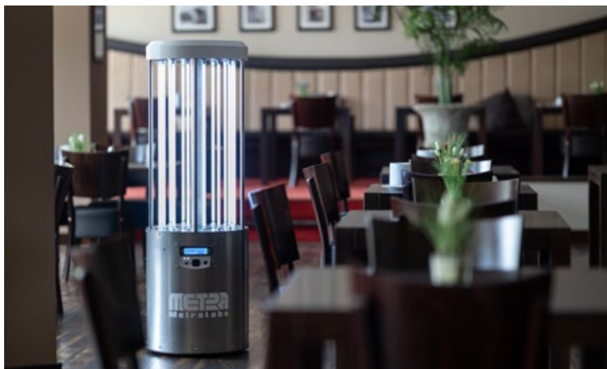
Auch in Restaurants kommt der „Sterybot“ zum Einsatz.

das Gerät selbstständig und desinfiziert neben der Raumluft ebenso Böden, Wände, Tischplatten, Stühle, Türklinken oder Lichtschalter. Zum Einsatz kommen wird er vor allem in Kliniken, aber auch in Hotels, Flughäfen oder Geschäften. Im Rahmen eines EU-Wettbewerbs gehört der „Sterybot“ zu 9 von ursprünglich 146 eingereichten Projekten, die von der EU zur Corona-Bekämpfung gefördert werden. Metralabs ist seit 15 Jahren in Thüringen tätig und profitiert von der innovativen Unternehmens- und Forschungslandschaft rund um die renommierte Technische Universität Ilmenau. (hw)