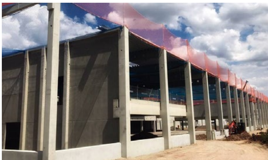
Panem baut seine zweite Werkshalle in Bleicherode