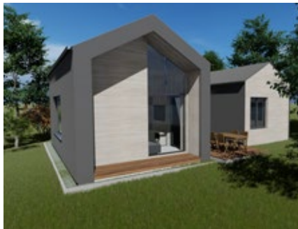
MANOAH Ferienhäuser, Architekturbüro Müller & Lehmann GmbH

Pünktlich im Herbst sollen die 21 Häuser fertig sein und Besuchern einen wundervollen Platz zur Entspannung und Erholung bieten. Seitdem die Talsperre im Jahr 2012 ihren Trinkwasserstatus abgeben konnte, hat sich das Zeulenrodaer Meer zu einem echten Geheimtipp gemauert: In enger Abstimmung mit den Verantwortlichen vor Ort haben Stadt- und Regionalentwickler der LEG Thüringen in