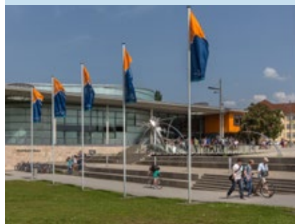
Die TU Ilmenau landet in Rankings regelmäßig auf den vorderen Plätzen.